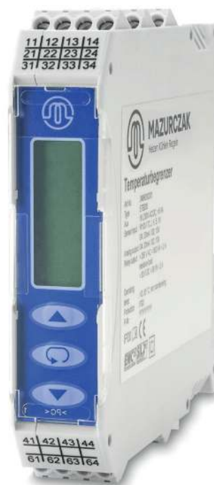
Limiteur de température ETB 200

Le limiteur de température agréé par le TÜV selon la norme DIN EN 14597, en association avec notre sonde de température certifiée TF 24-160/SMG00-M, présente un système de limitation de