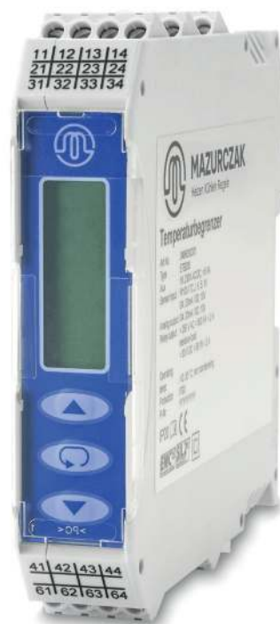
Limiteur de température ETB 200

Le limiteur de température agréé par le TÜV selon la norme DIN EN 14597, en association avec notre sonde de température certifiée TF 24-160/SMG00-M, présente un système de limitation de