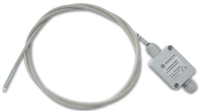
Sonde de température avec gaine de protection souple

La température de fonctionnement maximale de la sonde de température s'élève à 200°C.